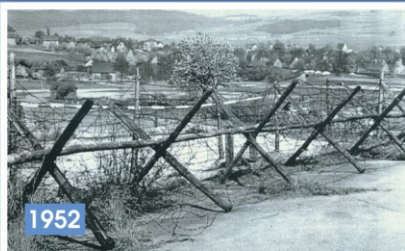
Bahnlinie Bebra-Eisenach bei Obersuhl