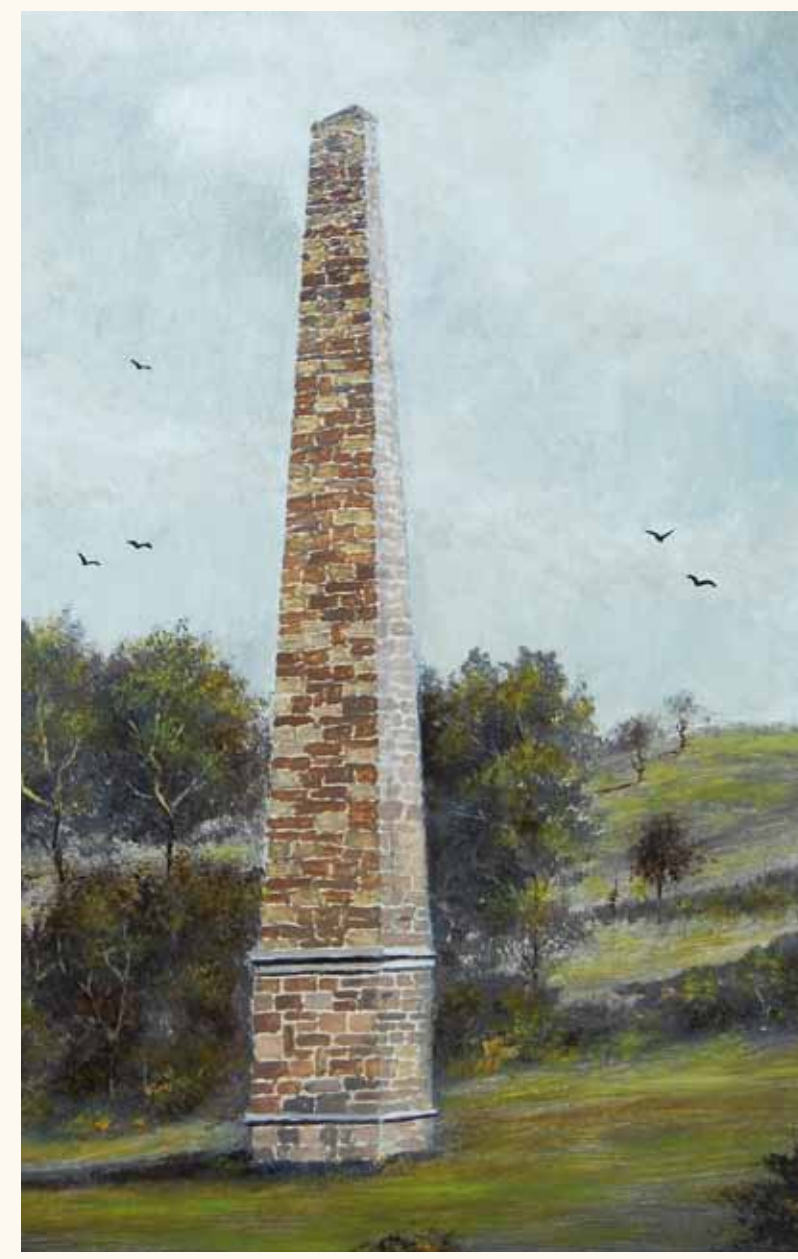
Ansicht des Obeliskens

Mein Vater, der Landgraf Emanuel, heiratete 1771 die 17-jährige Prinzessin Leopoldina von Liechtenstein, meine Mutter. Um ihr seine Liebe zu zeigen, ließ er 1790 diesen Obeliskens errichten, der nach der Herkunft meiner Mutter auch „der Liechtenstein“ genannt wurde. Gemeinsam mit mehreren Pavillons war er gleichzeitig ein Gestaltungselement des Landschaftsgartens, zu dem mein Vater einen großen Teil dieses Tals formte.