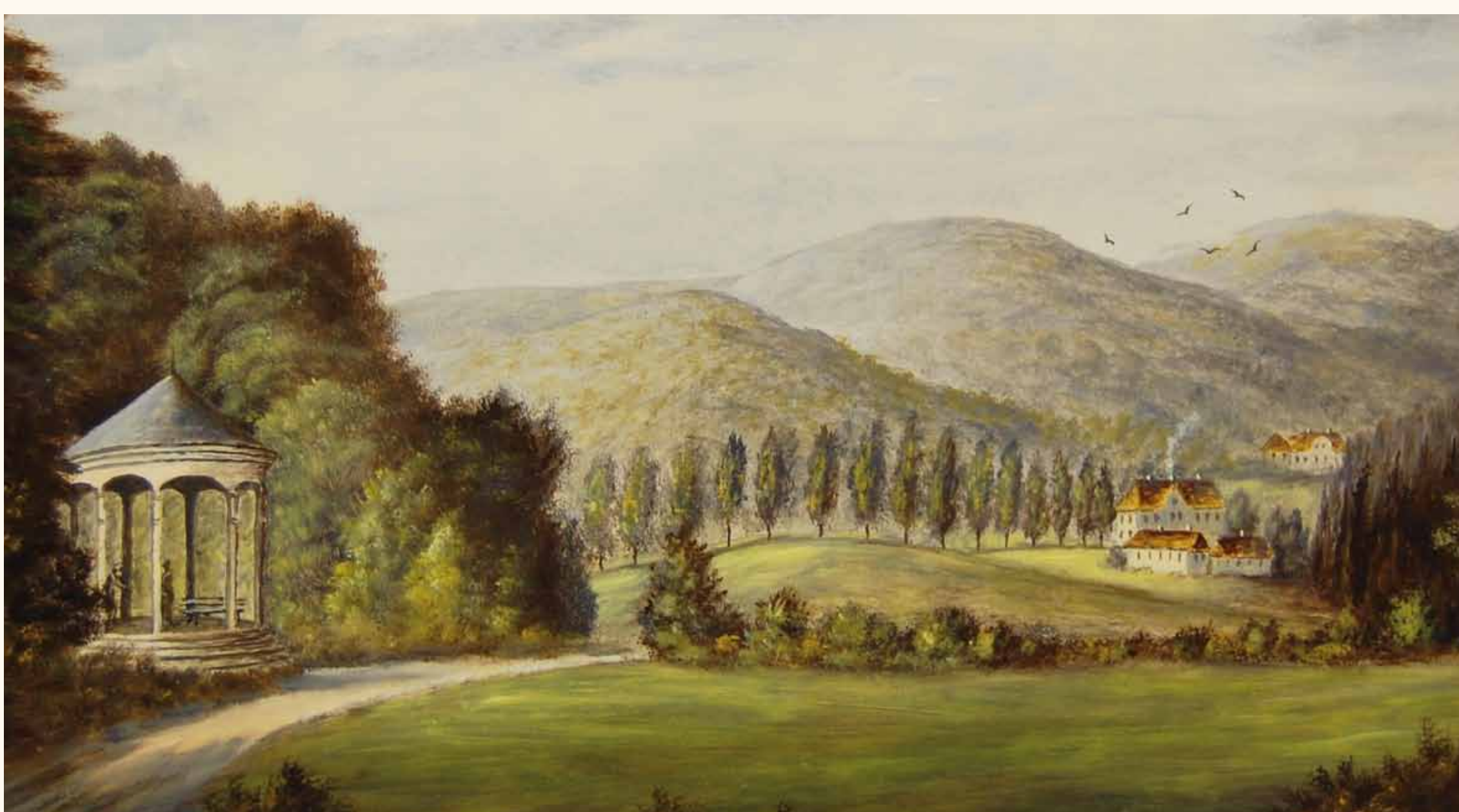
Nördlich vom Schloss gab es einen ähnlichen Pavillon, Clothildenruh. Leider sind von diesen Pavillons oder Tempelchen heute keine Überreste mehr vorhanden. Auch viele weitere künstliche Parkanlagen wie kleine Steinbrücken, Grotten oder lauschige Ruheplätze mit Moos und Steinbänken sind verschwunden. Es gab eine „Nanettenruh“, eine „Eremitage Heloise“, ein „Fass des Diogenes“ und einen „Regenschirm“.