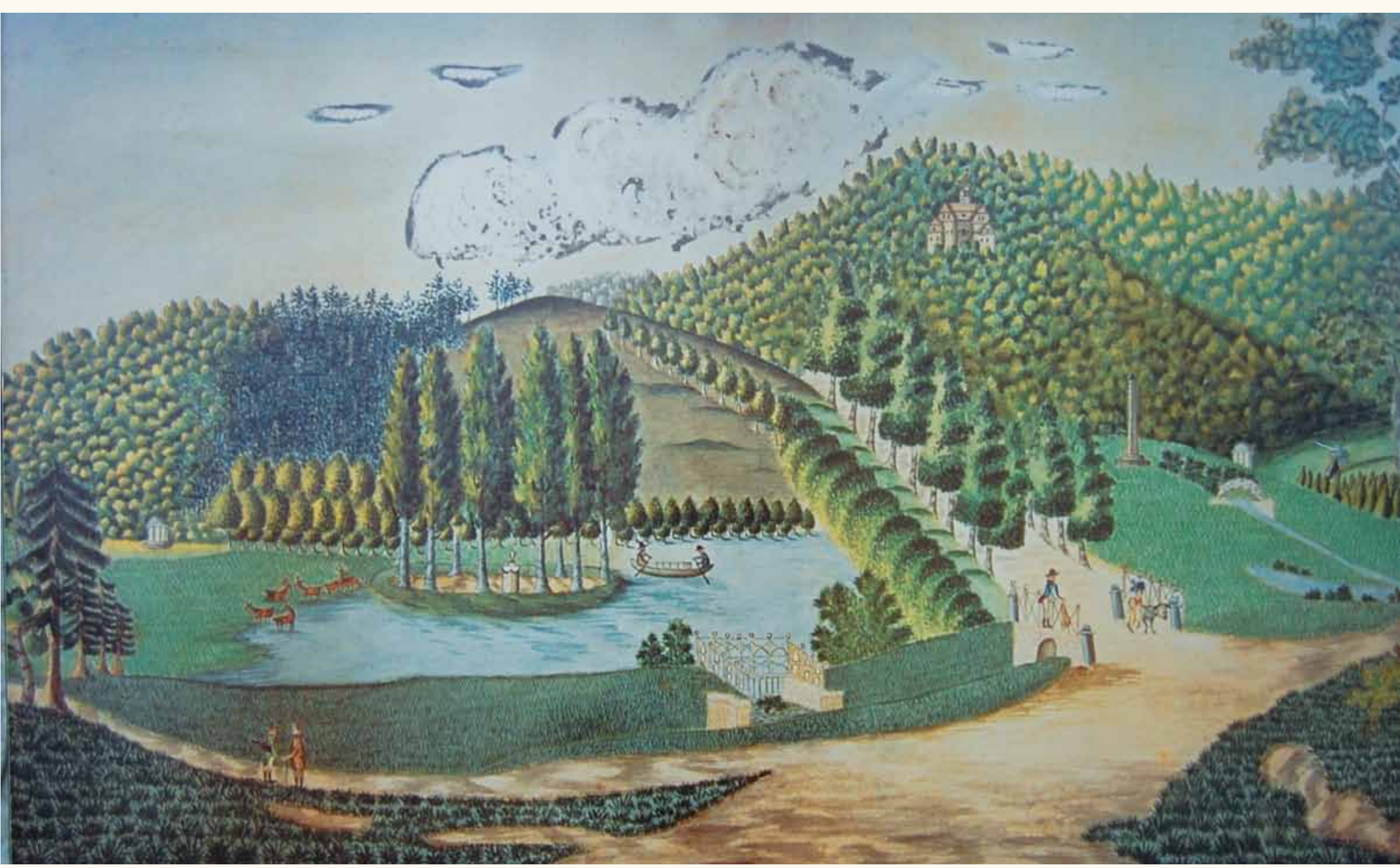
Das Bild eines unbekanntes zeitgenössischen Malers zeigt noch einen Pavillon im Stubachtal, links der Insel, und einen anderen unterhalb der Chinesischen Brücke, rechts im Bild.